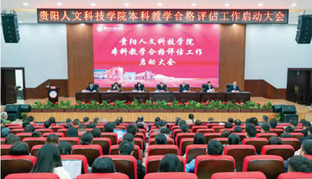
贵阳人文科技学院本科教学合格评估工作启动大会现场

届四中全会精神，戮力同心、真抓实干，以合格评估优异成绩在以中国式现代化全面推进强国建设、民族复兴伟业新实践中展现人文新风采、贡献人文新力量！